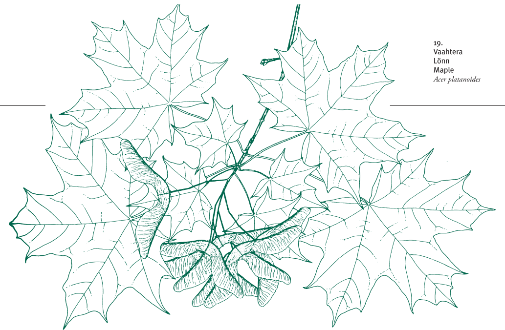
19. Vaahtera Lönn Maple Acer platanoides

21. Harmaapihta Coloradogran Silver Fir Abies concolor